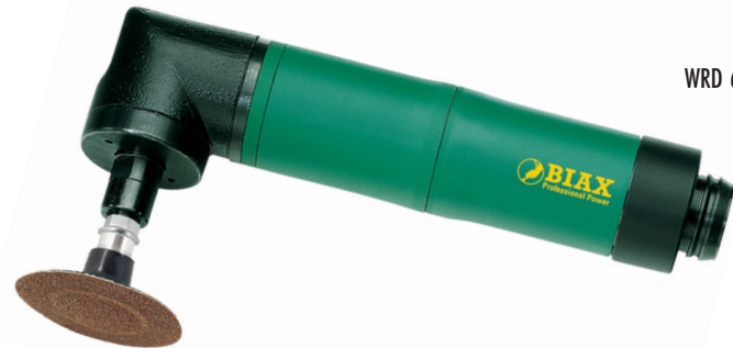
WRD 6-20/3 Z