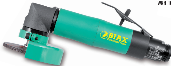
WRH 10-20/3 S